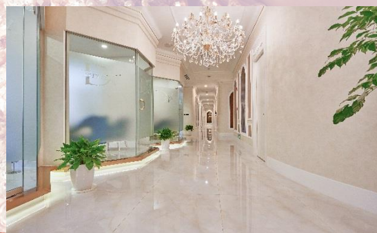
上海笛絲薇夢威寧店