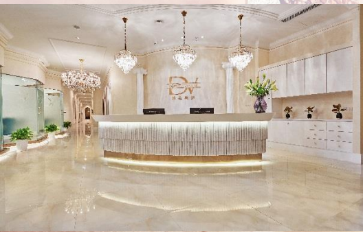
上海笛絲薇夢 南京路西店