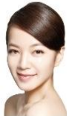
2011 產品代言人 阿雅