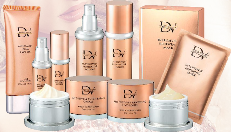
極效賦活金萃系列