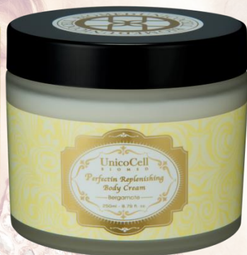
完美因子美體霜(佛手柑)