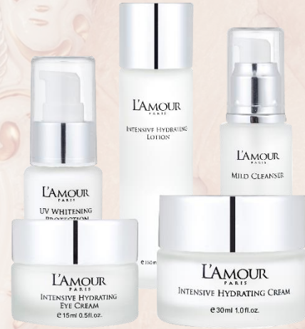
多元保溼修護系列