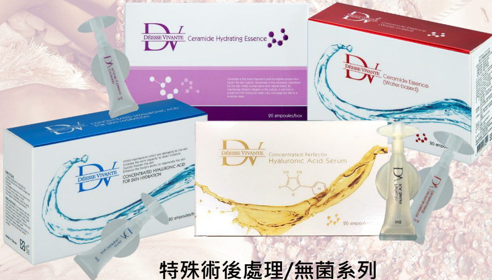
特殊術後處理/無菌系列