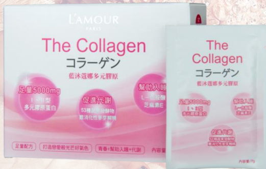
藍沐蔻娜膠原蛋白