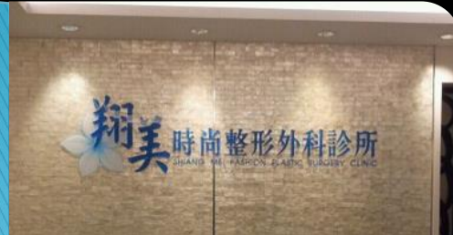
翔美時尚整形外科診所